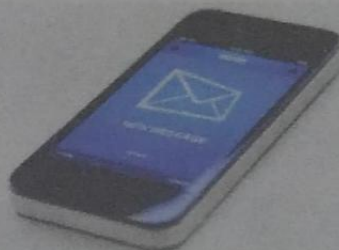
Escrita, visual e oral.